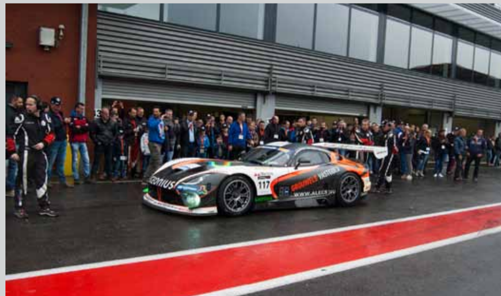
Klanten bekijken Dodge Viper voor de start.

Kortom, we kijken terug op een geweldige klantendag én een perfect raceseizoen. Want met vreugde kunnen wij u melden dat Team RaceArt het kampioenschap heeft binnengehaald tijdens de Finale Races in Assen. Verslag van deze laatste race kunt u lezen op onze website. De foto's van de klantendag zijn te vinden op onze Facebookpagina, Facebook.com/GeoniusEU.